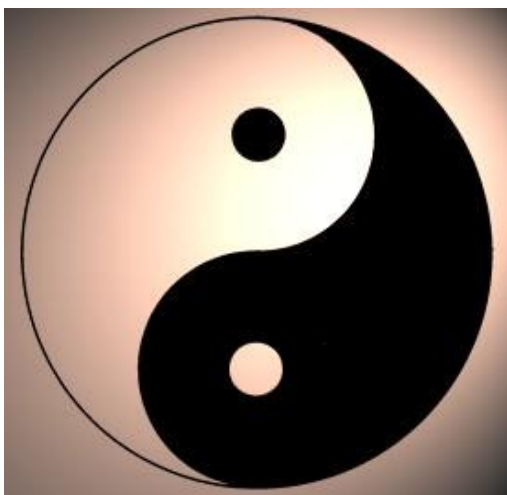
(Symbol Yin & Yang)

Wenn der Tag sich dem Ende neigt, beginnt die Nacht, wenn sie endet graut der Morgen des nächsten Tages.